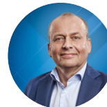
Kaj Leo Holm Johannesen